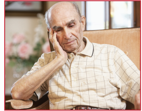
El abuso de ancianos incluye el daño provocado por personas conocidas por la víctima, con las que tiene una relación o de las cuales depende para ciertos servicios.

Para reportar abusos de ancianos o abusos de adultos dependientes en la comunidad, comuníquese con la oficina de APS de su condado en www.cdss.ca.gov/inforesources/Adult-Protective-Services . También puede reportar abusos a la policía local.